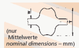
(nur Mittelwerte nominal dimensions – mm)